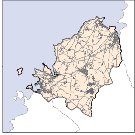
Echelle : 1/10 000ème