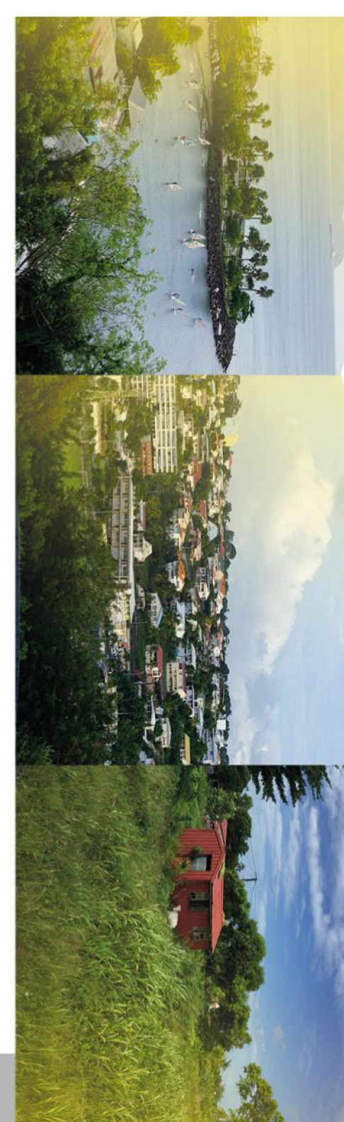
Zonage - Planche Ouest

PLU mis en révision le 25/11/2015 PLU arrêté le 26/05/2019 PLU approuvé le