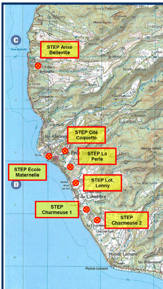
Figure 1 : Localisation des stations d'épurations existantes sur la commune du Prêcheur

Le traitement des effluents est actuellement effectué sur 7 stations localisées sur la carte ci-après :