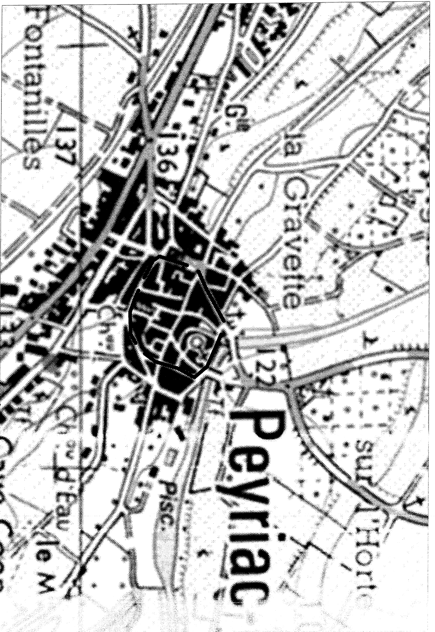
--- site inscrit du centre ancien (no. 12.1976)