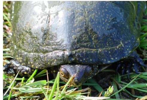
Cistude d'europe - Nature Environnement 17

Le site héberge 81% des espèces de chiroptères recensées en Charente-Maritime, ce qui en fait un site exceptionnel. Les espèces présentes sont protégées nationale et européenne.