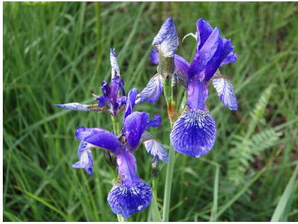
Iris de sibérie – Nature Environnement 17

Avec 600 espèces de plantes recensées, dont 28 espèces patrimoniales, ce site est considéré comme le plus riche de Poitou-Charentes pour la flore tout statuts confondus.