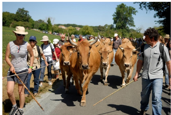
Nature Environnement 17

Le pâturage des parcelles de marais. Tous les ans, les prairies humides sont pâturées par des vaches maraîchines. C'est dans ce cadre que sont organisées les transhumances du troupeaux depuis le Domaine de Berthegille jusqu'aux parcelles de la réserve.