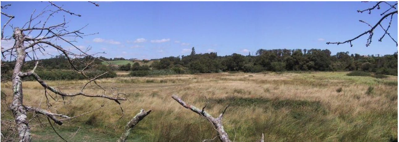
Nature Environnement 17

L'accueil du public au sein de la réserve se fait principalement via des sorties natures, organisées régulièrement par les gestionnaires et les propriétaires.