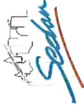
Emplacement objet de la modification simplifiée